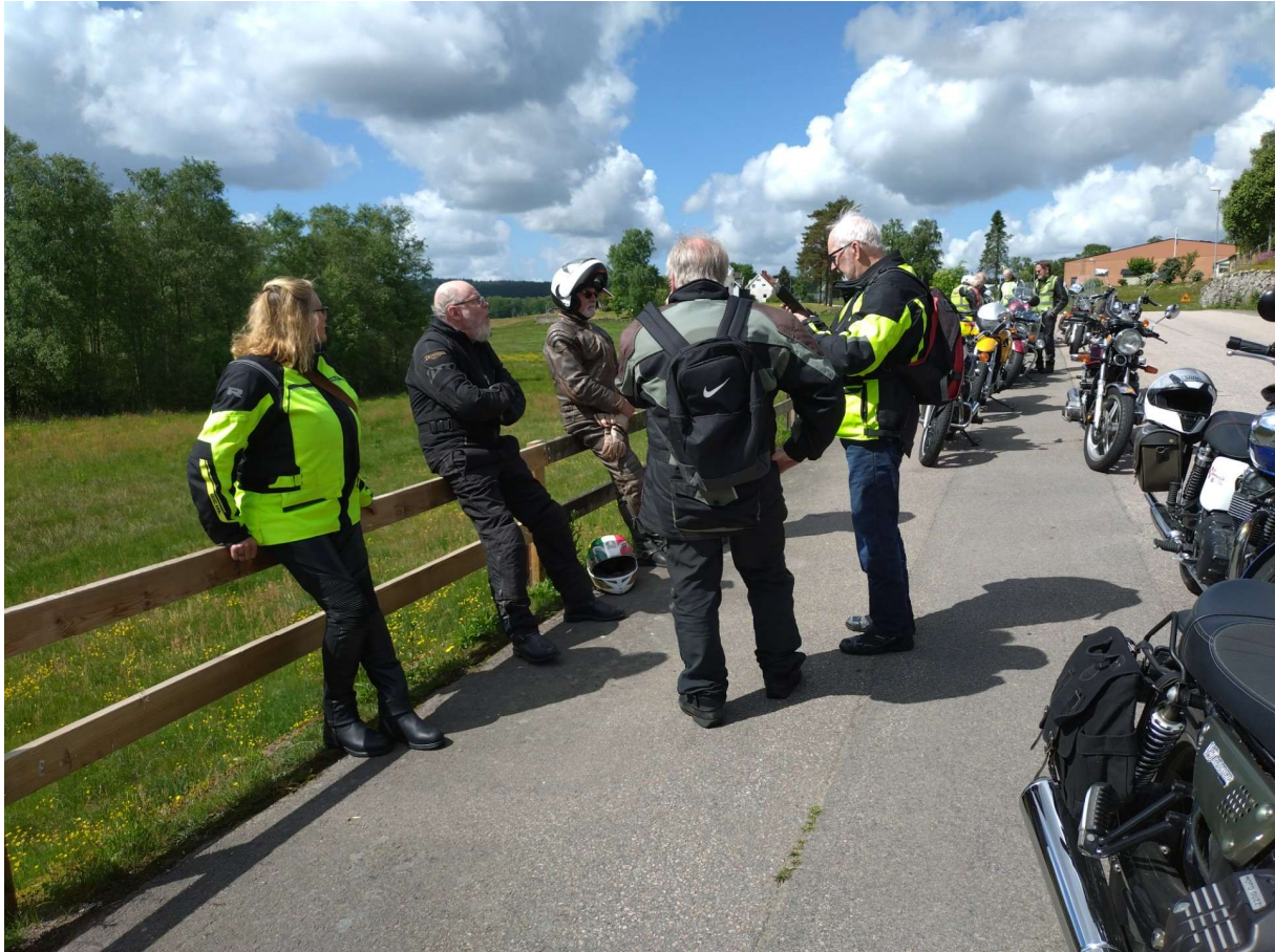
Text och bild Kent Elofsson