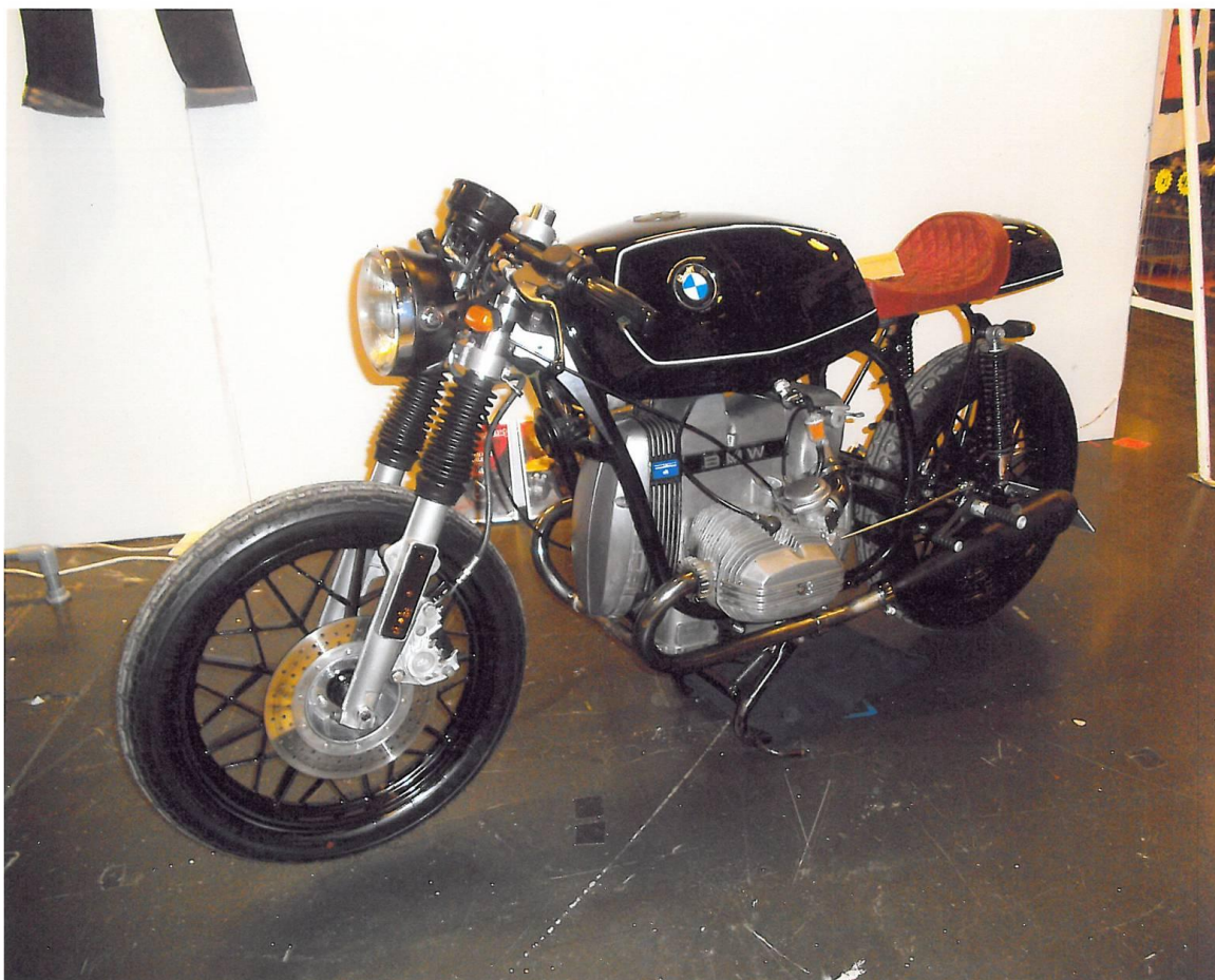
Ombyggd BMW med lite bobber och race-stuk