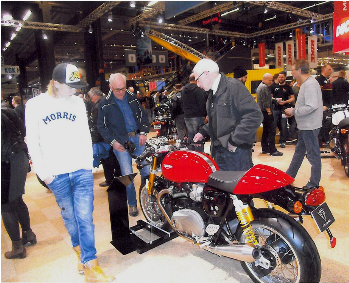
Här beundras en Thruxton "Caferacer" av senaste modell.