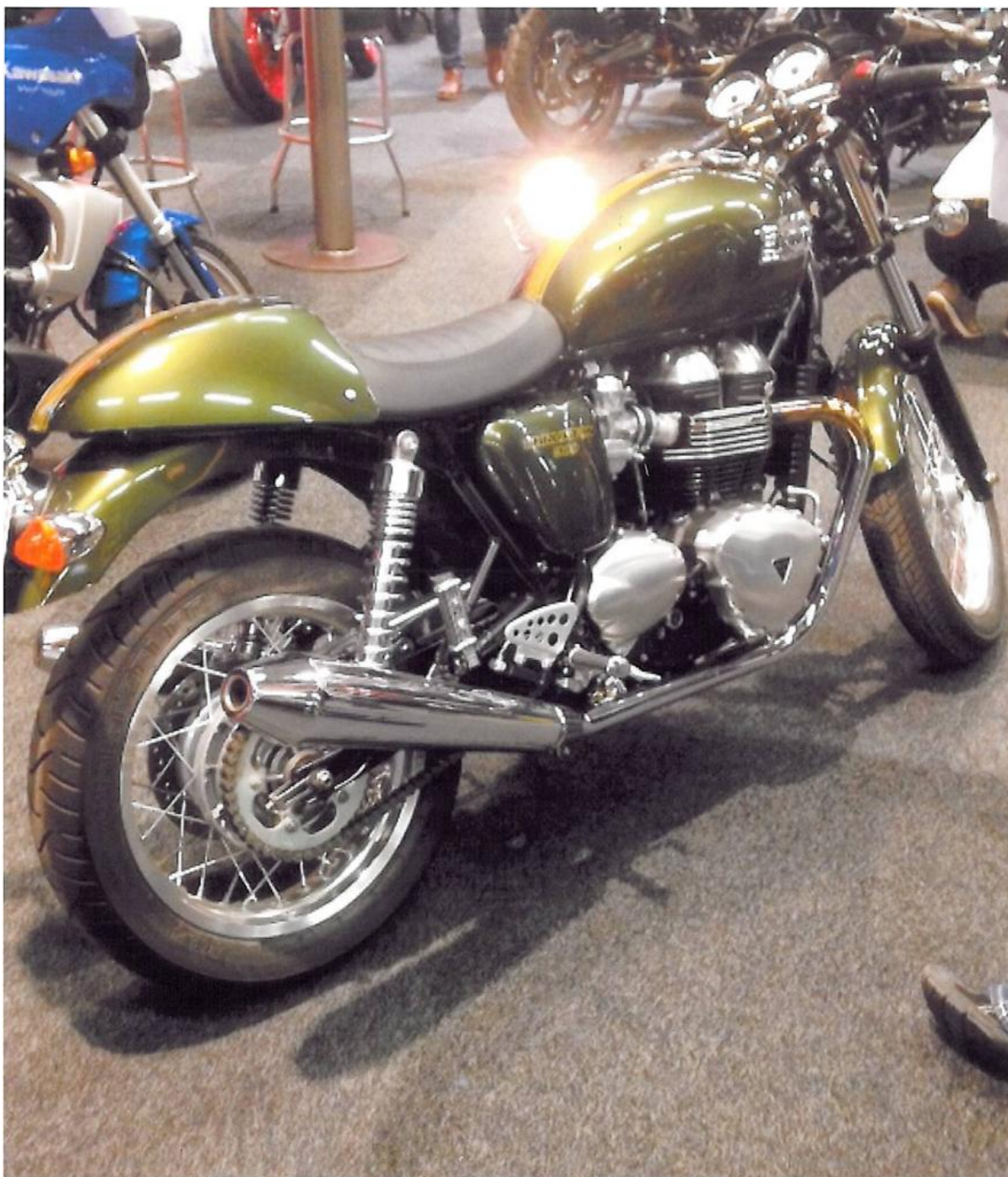
En lækker Triumph Thruxton från Johan MC:s monter. Begagnad men bara körd 53 mil.

Här följer lite bilder över vad vi fotograferade och vad undertecknad har valt ut.