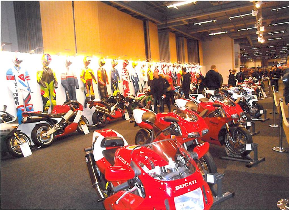
Tony Dönges monter fylld med, om jag hörde rätt, totalt 21 blankpolerade roadracinghojar och en maffig uppsättning av skinnställ och hjälmar hängande på väggen. Mäktigt!