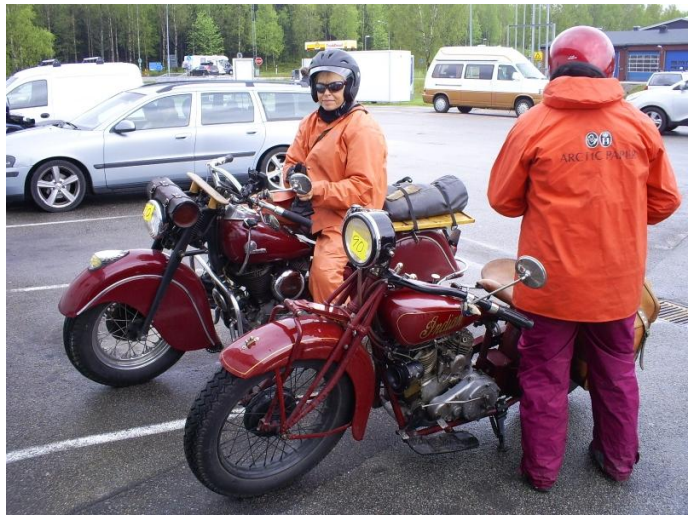
Två kvinnliga Indianförare