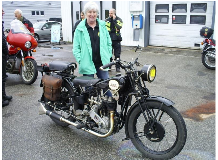
Hustru med Rex.