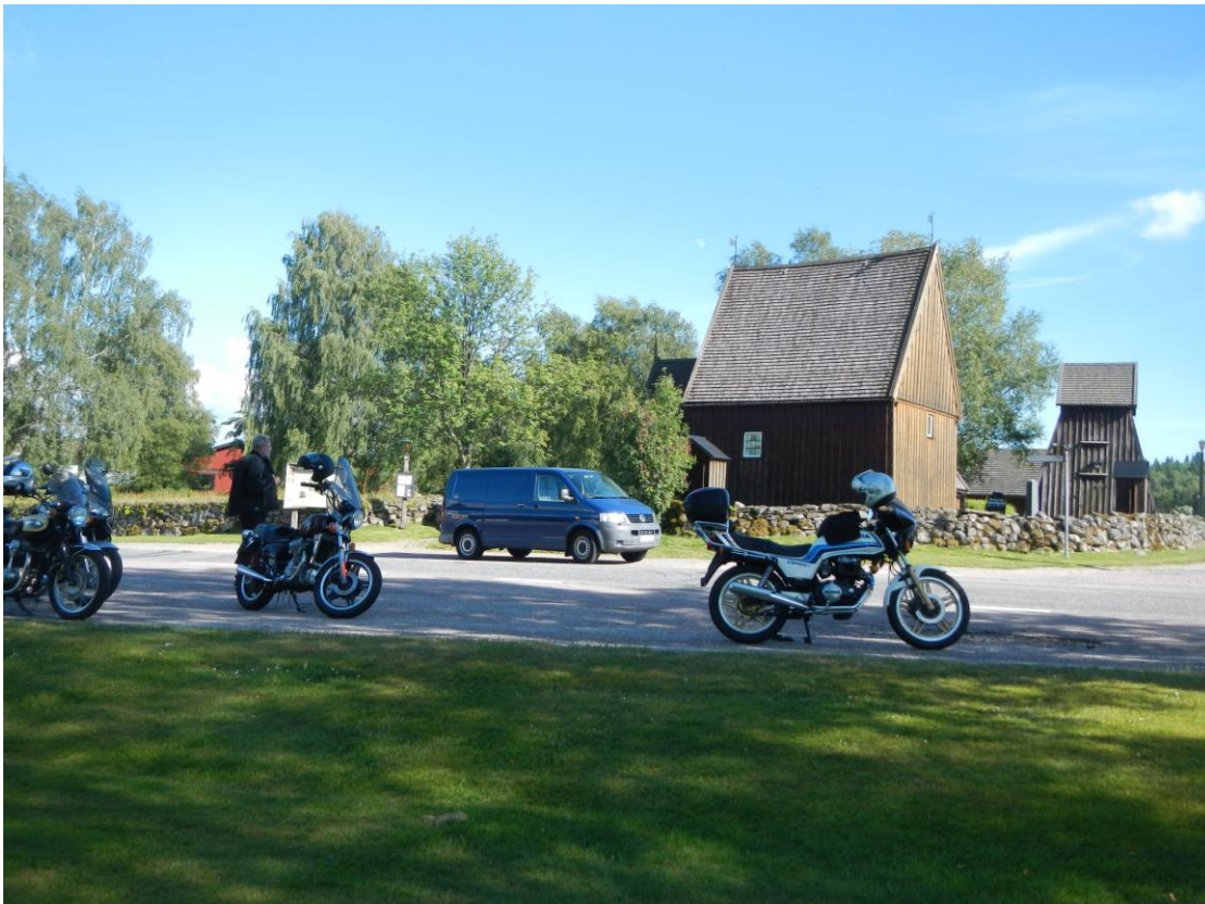
Sista stoppet, Hedareds Stavkyrka.