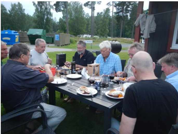
Nu äter vi god ytterfilé och dricker vin.