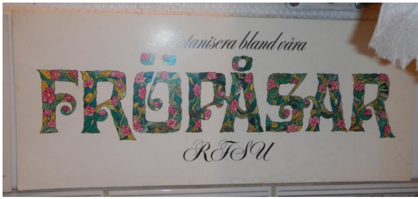
Det fanns sedelärande reklam på toa...