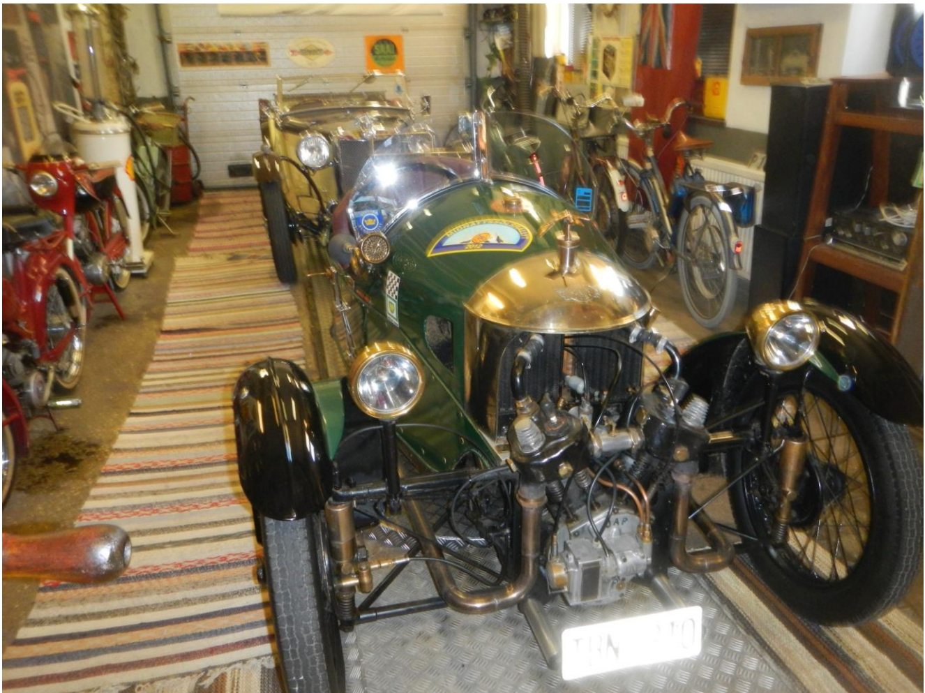
Inne på macken, 3-hjulig veteranbil, en Morgan med JAP motor.