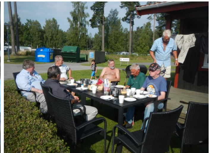
Frukost i klass med bästa hotellfrukosten fick vi också före hemresan.