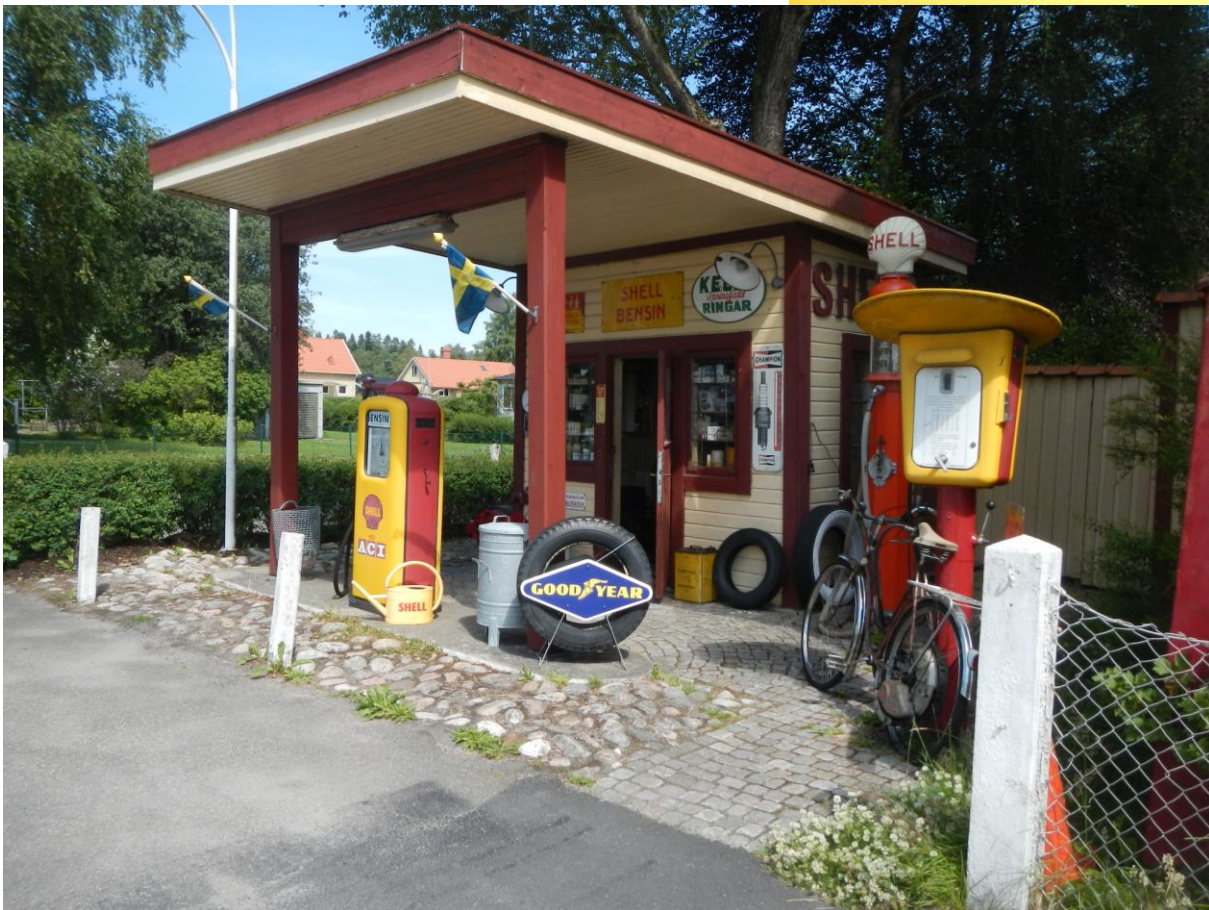
Nedan tv Macken i Sollebrunn