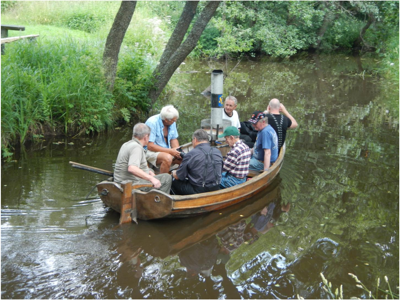
Vid Huttla Kvarn provar några av oss på en ångbåtstur med "Huttlandia", en vedeldad ångbåt.