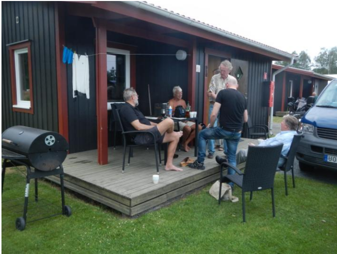
Avkoppling efter resan