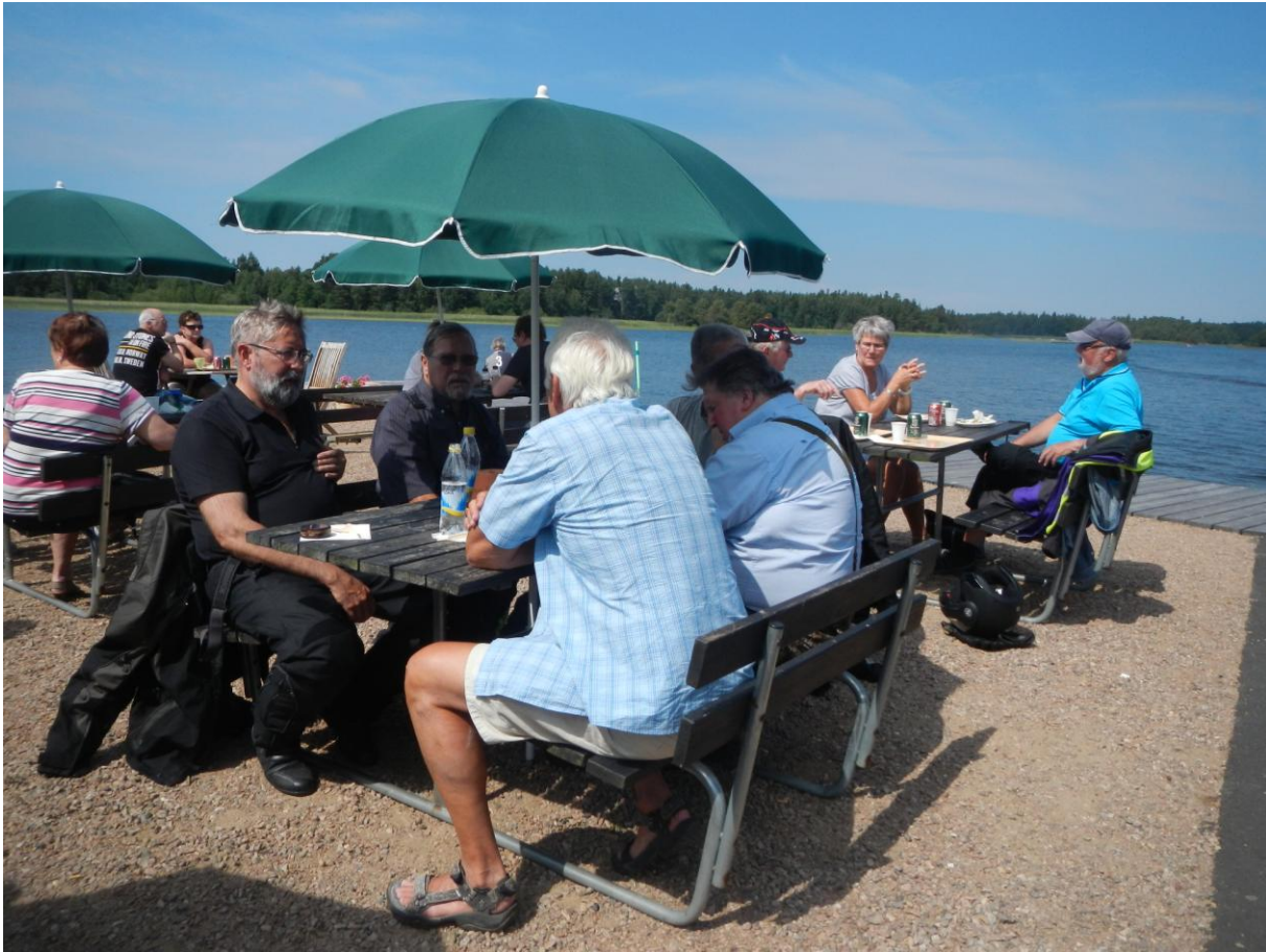
Laxtallrik till lunch, Spikens Fiskeläger.